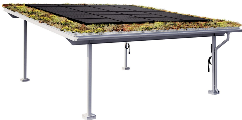
- Carporten på bilden har tillvalen sedum samt laddbox .

Finns i två standardmått, enkel respektive dubbel, med möjlighet till viss måttanpassning och med en tillvalslista full av möjligheter.